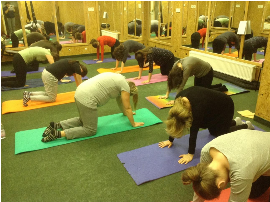
Fotó kismama torna 2019. évben 125 fő várandós tornázott